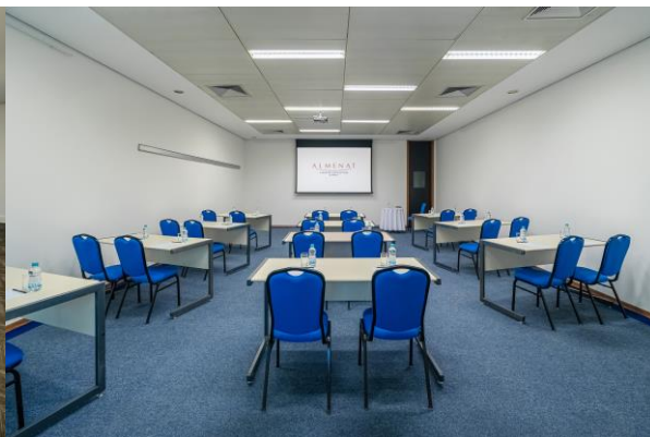
Salas intermediarias 03 a 12