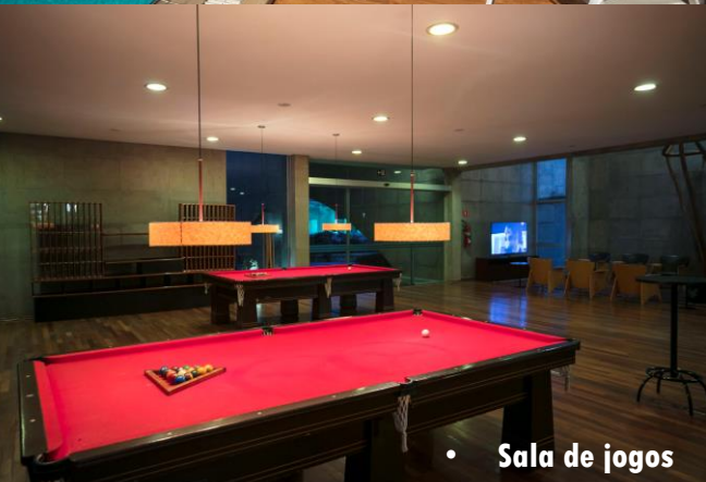
• Sala de jogos