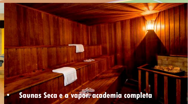
• Saunas Seca e a vapor, academia completa