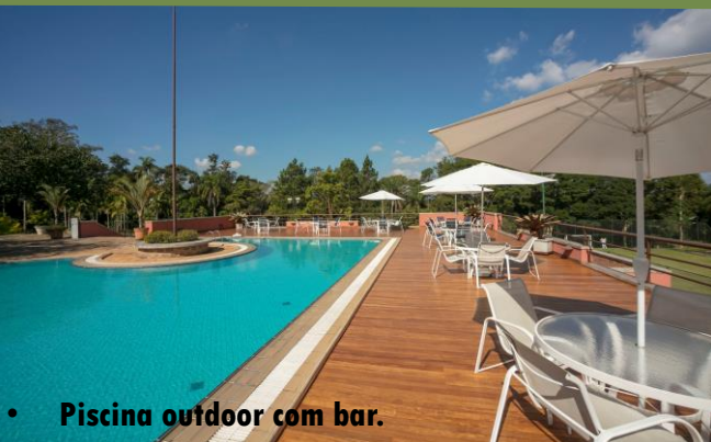
• Piscina outdoor com bar.