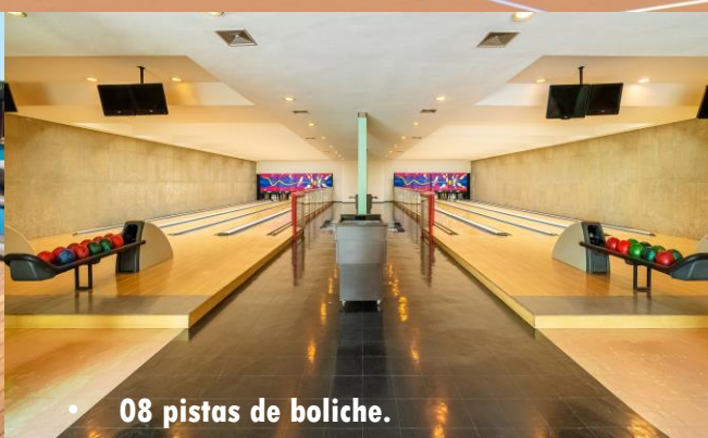
• 08 pistas de boliche.