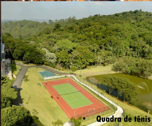
• Quadra de tênis