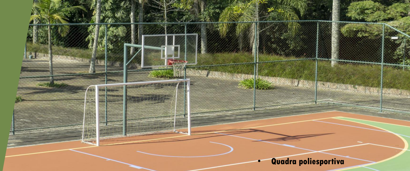
• Quadra poliesportiva