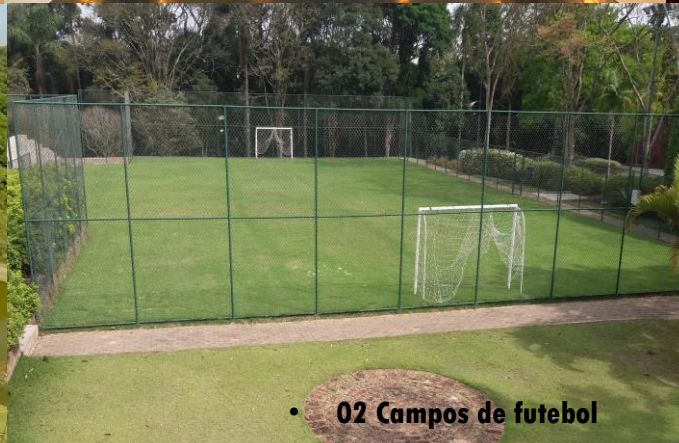
• 02 Campos de futebol