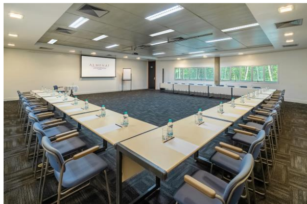
Salas grandes 19 a 22