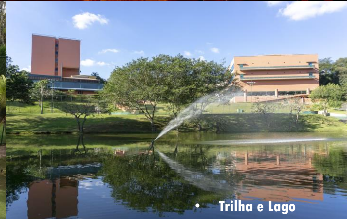
• Trilha e Lago