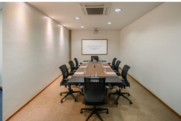
Salas pequenas 13 a 18