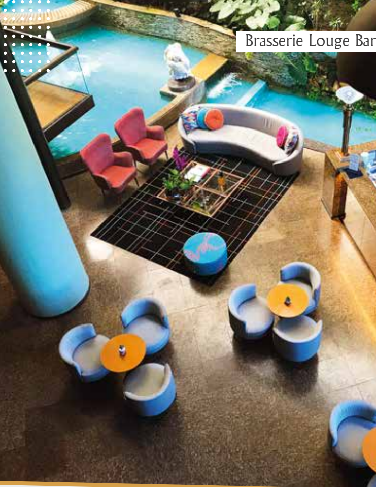
Brasserie Lounge Bar